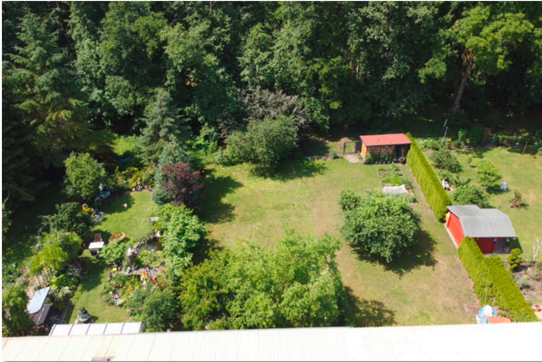
Garten hinter dem Haus