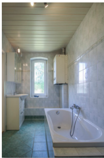
Bad mit Wanne und separater Dusche