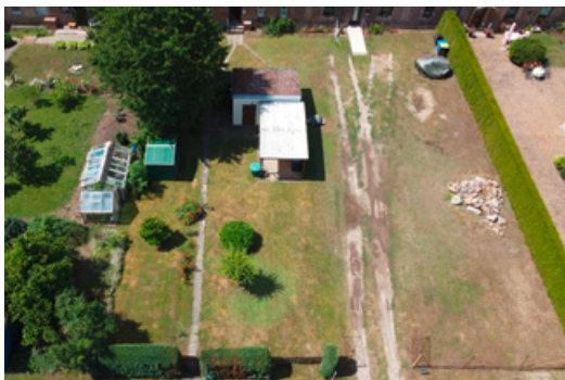
Grundstück vor dem Haus