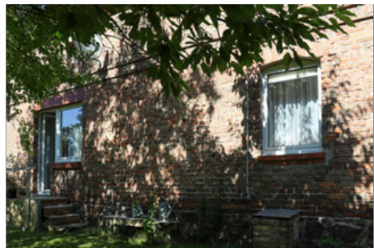
Zugang von hinteren Garten